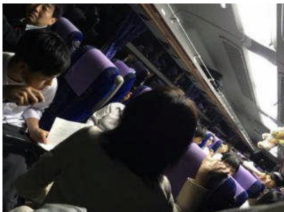
新幹線の中の様子です。

新幹線は予定通り新神戸駅に着きました。バスに乗り換えて学校まで向かいます。再びバスレクをしています。司会が上手に進行して、みんな楽しんでいます。